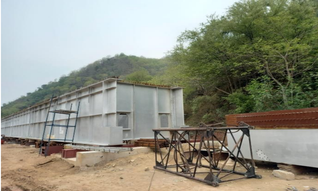
चित्र 3: आरवीएनएल चंडीगढ़ बीबीबी ब्रिज साइट पर असेंबली