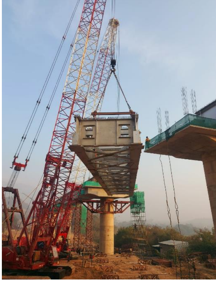
चित्र 2: ब्रिज-4 पर सीधे 30.5 मीटर स्पैन के लिए लॉन्चिंग, आरवीएनएल बीबीबी परियोजना, केआरसीएल इंजीनियरों द्वारा पर्यवेक्षण।