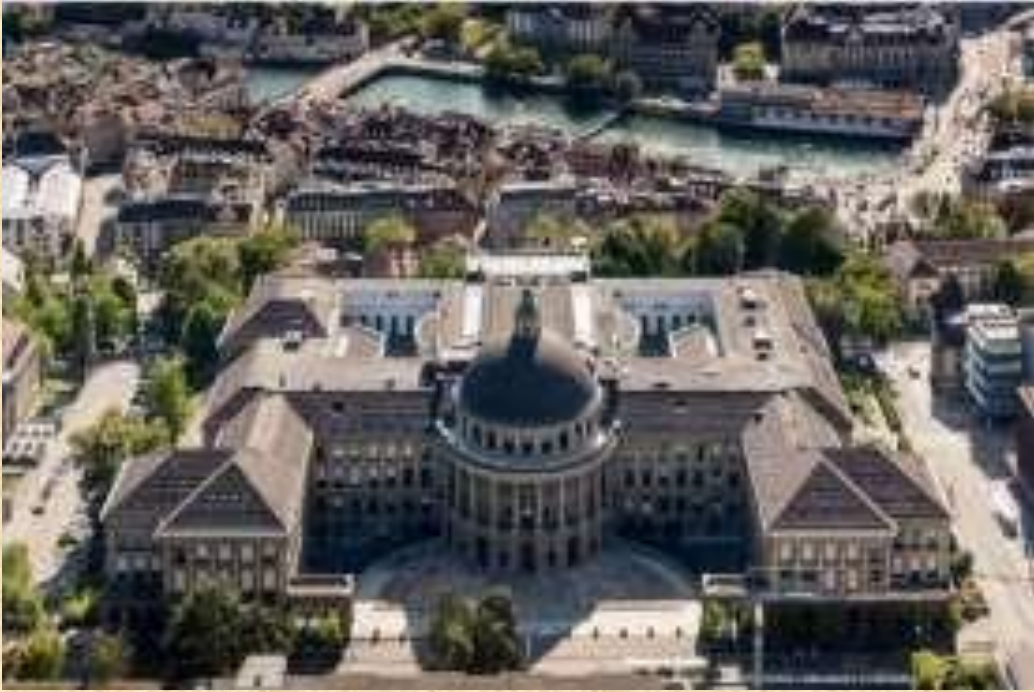
ETH ज्यूरिख मुख्य भवन