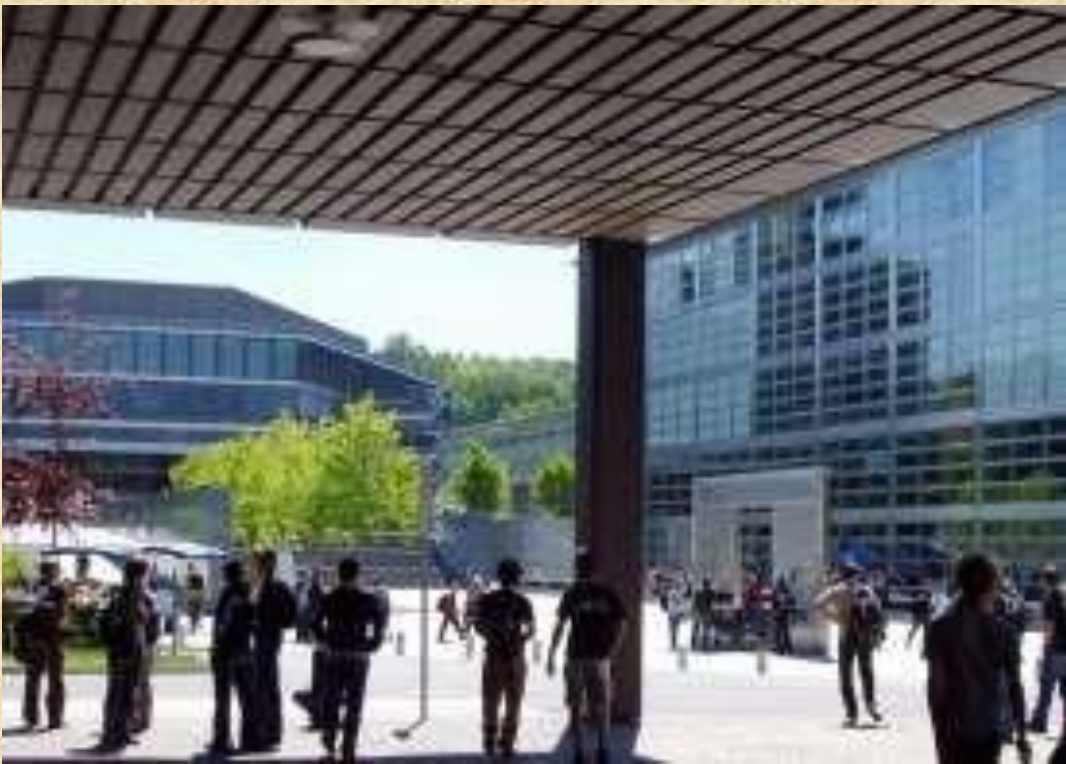
ETH ज्यूरिख के Hönggerberg परिसर