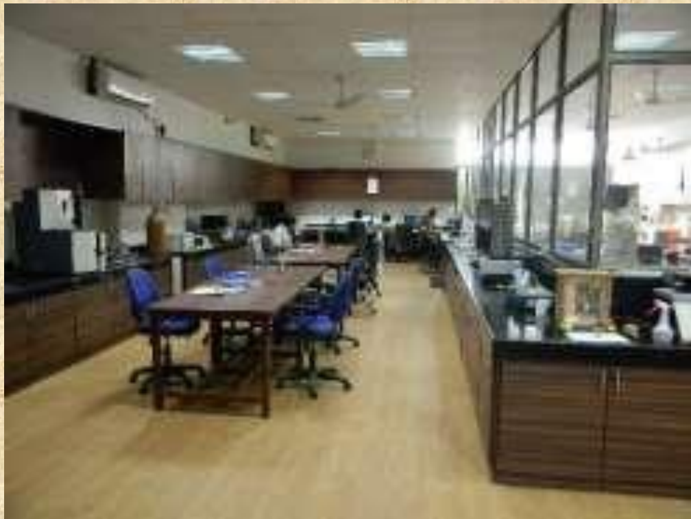
आईआईटी बॉम्बे की भू-तकनीकी प्रयोगशाला