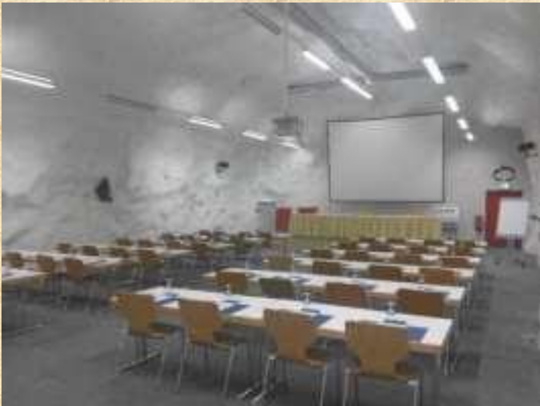
हैगरबैक में फ्लम्स अंडरग्राउंड क्लासरूम