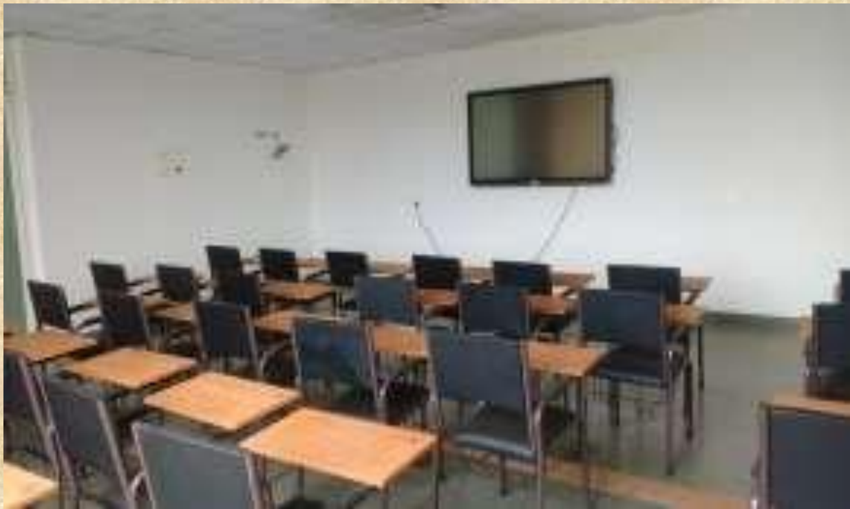
जॉर्ज फर्नांडिस इंस्टीट्यूट ऑफ टनल टेक्नोलॉजी, गोवा की कक्षा