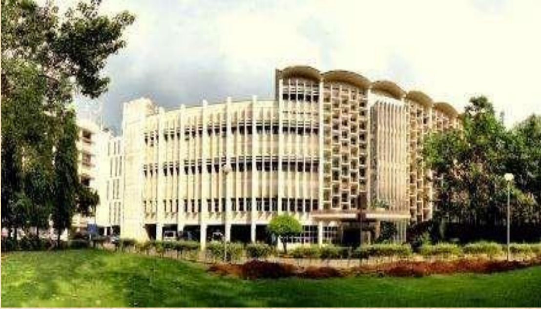
आईआईटी बॉम्बे मुख्य भवन