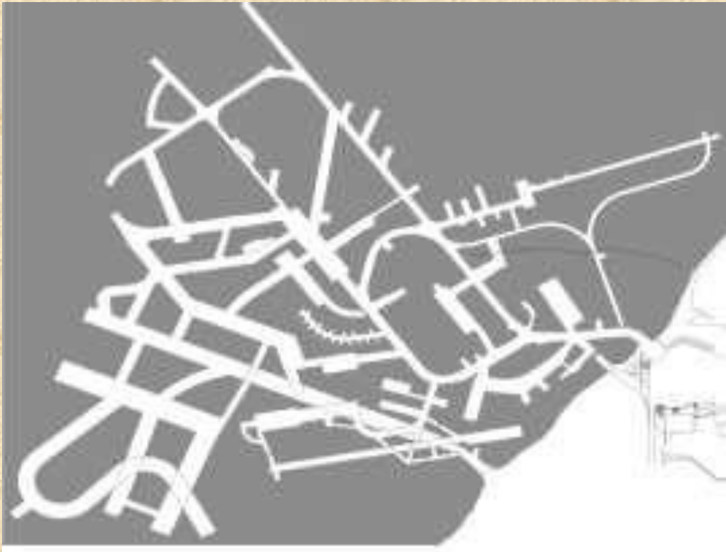
हैगरबैक टेस्ट गैलरी का लेआउट,