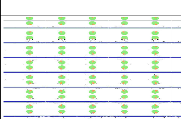
टीएमएमएस ग्राफिकल रिपोर्ट (पाई चार्ट)