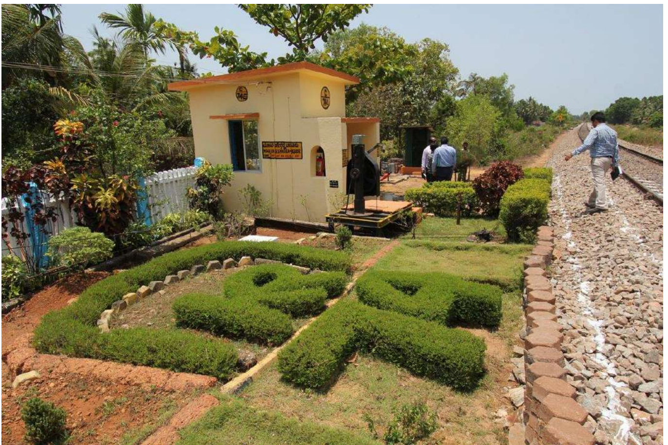
उडुपी जिले में बिजूर के पास समपार फाटक संख्या-74 पर गेट कीपर द्वारा की गई एक पहल