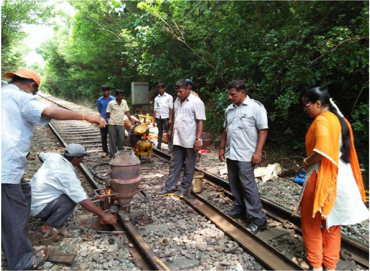
रेलों का अल्युमिनो-थर्मिक वेल्डिंग