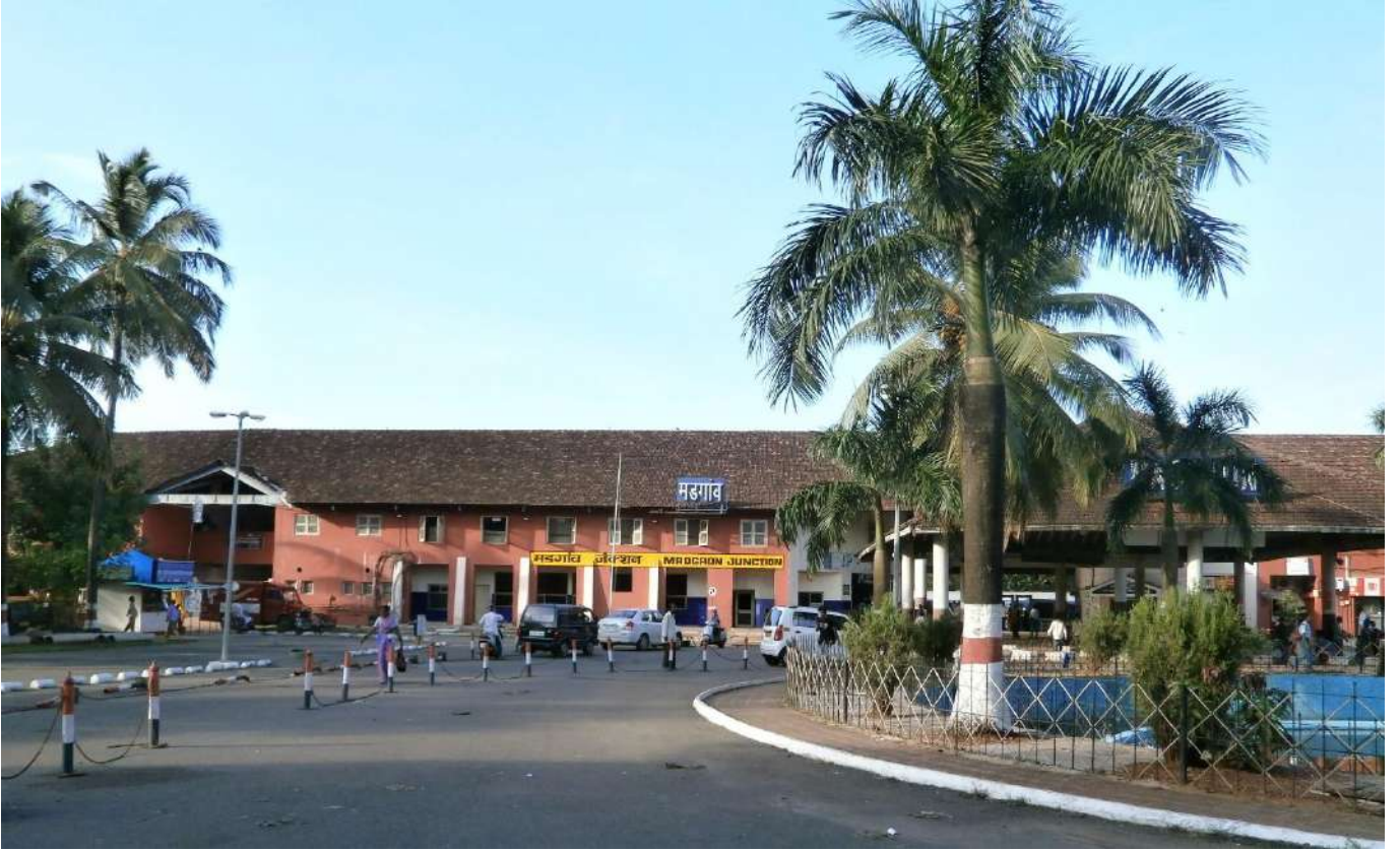
मडगांव स्टेशन, गोवा