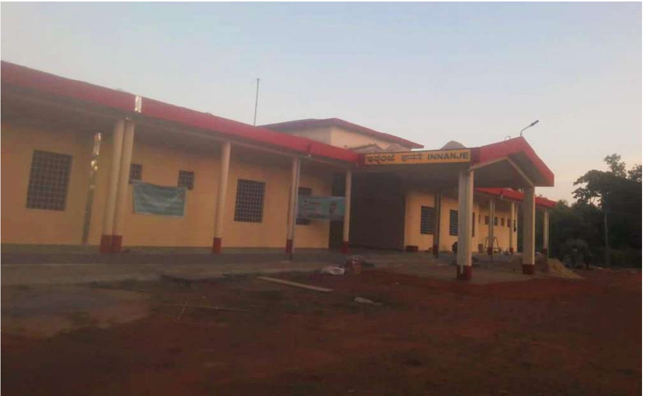
नई परिसंपत्तियों का निर्माण - कर्नाटक में उडुपी के पास इनन्जे स्टेशन