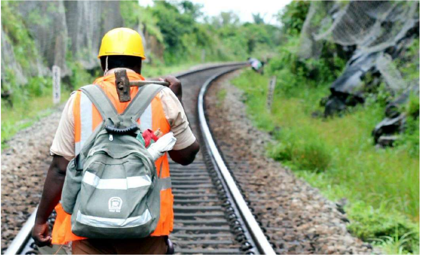
पेट्रोलिंग इयूटी कराते हुए ट्रैकमन