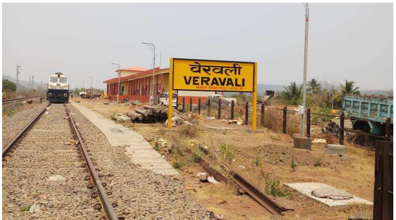
नई परिसंपत्तियों का निर्माण - महाराष्ट्र में विलवडे के पास वेरवली स्टेशन