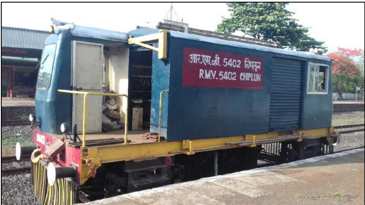
रेल अनुरक्षण वैन