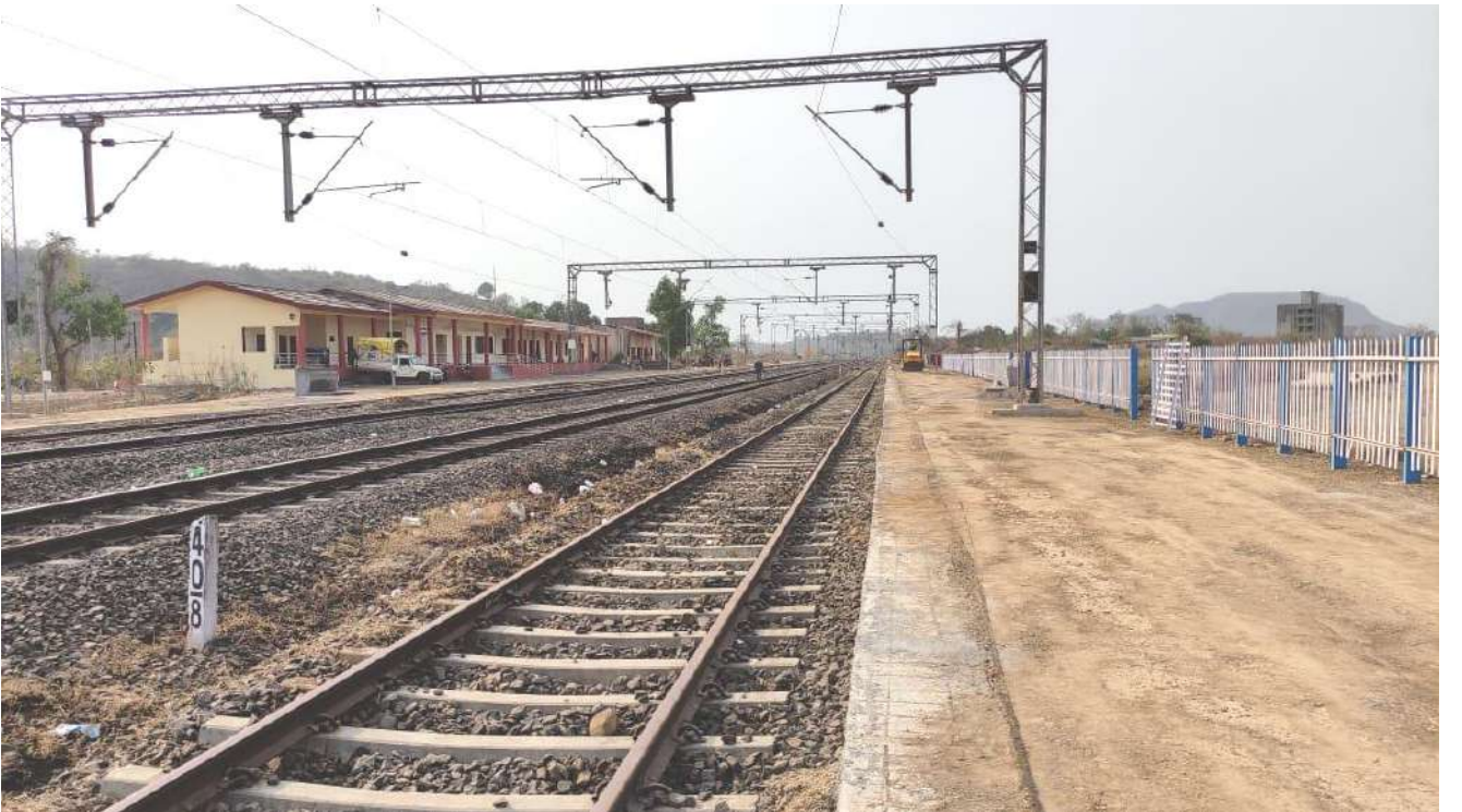
नई परिसंपत्तियों का निर्माण - महाराष्ट्र में वीर के पास गोरेगांव रोड स्टेशन