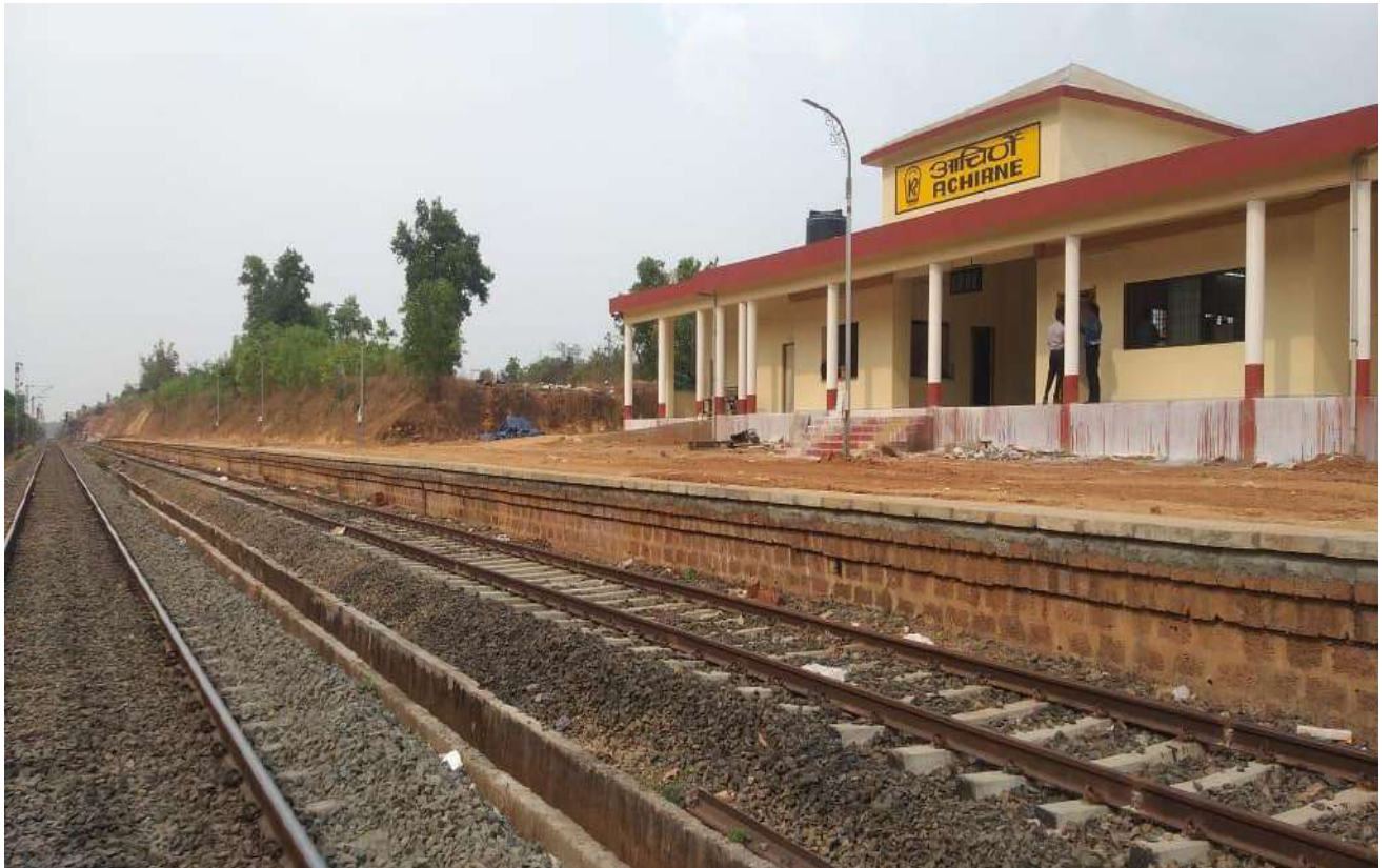
नई परिसंपत्तियों का निर्माण - महाराष्ट्र में नंदगाव रोड के पास आचिर्णे स्टेशन