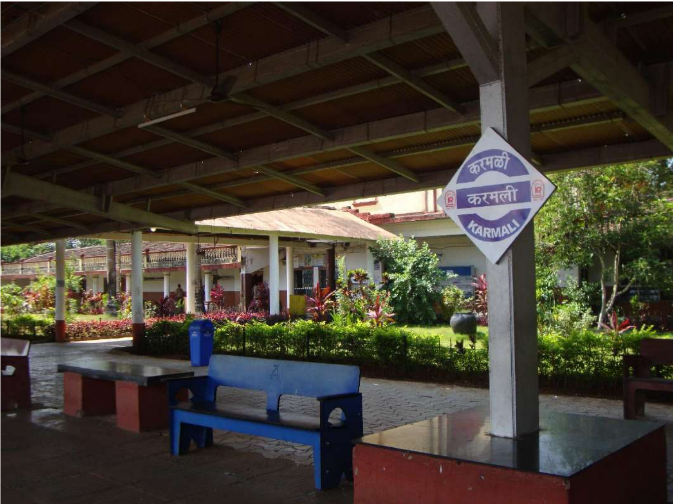
करमली स्टेशन, गोवा