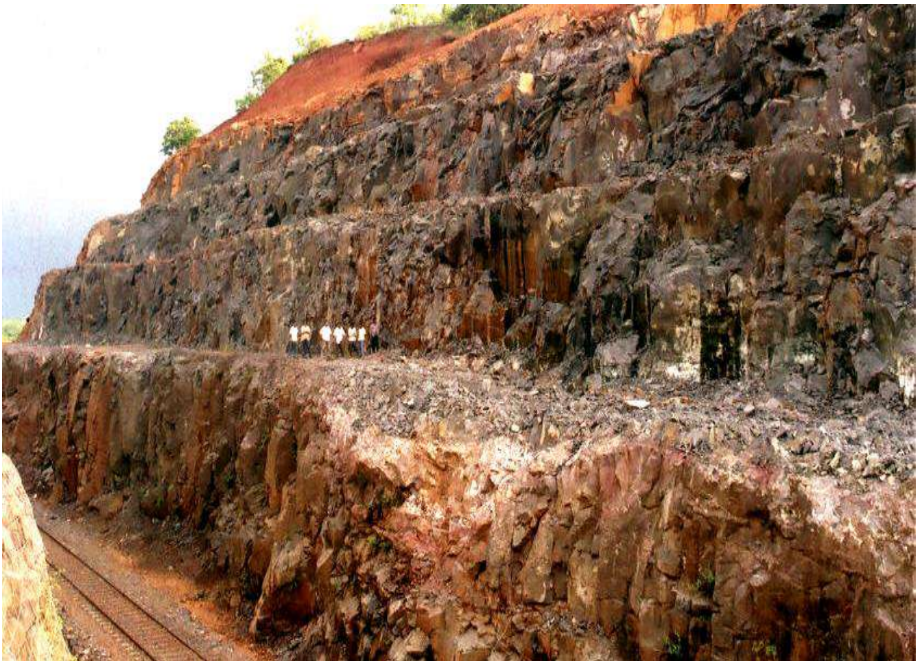
रॉक कटिंग के लिए ढलान समतल बनाने का कार्य (संरक्षा कार्य के पूर्व और पश्चात)