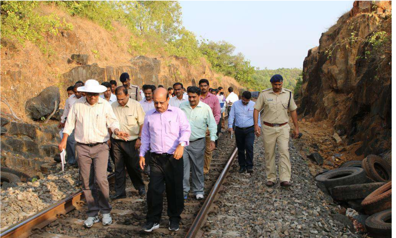
रेलवे सुरक्षा आयुक्त द्वारा कोंकण रेलवे के अध्यक्ष एवं प्रबंध निदेशक, निदेशकों और अन्य अधिकारियों के साथ सेक्शन का मानसून पूर्व निरीक्षण