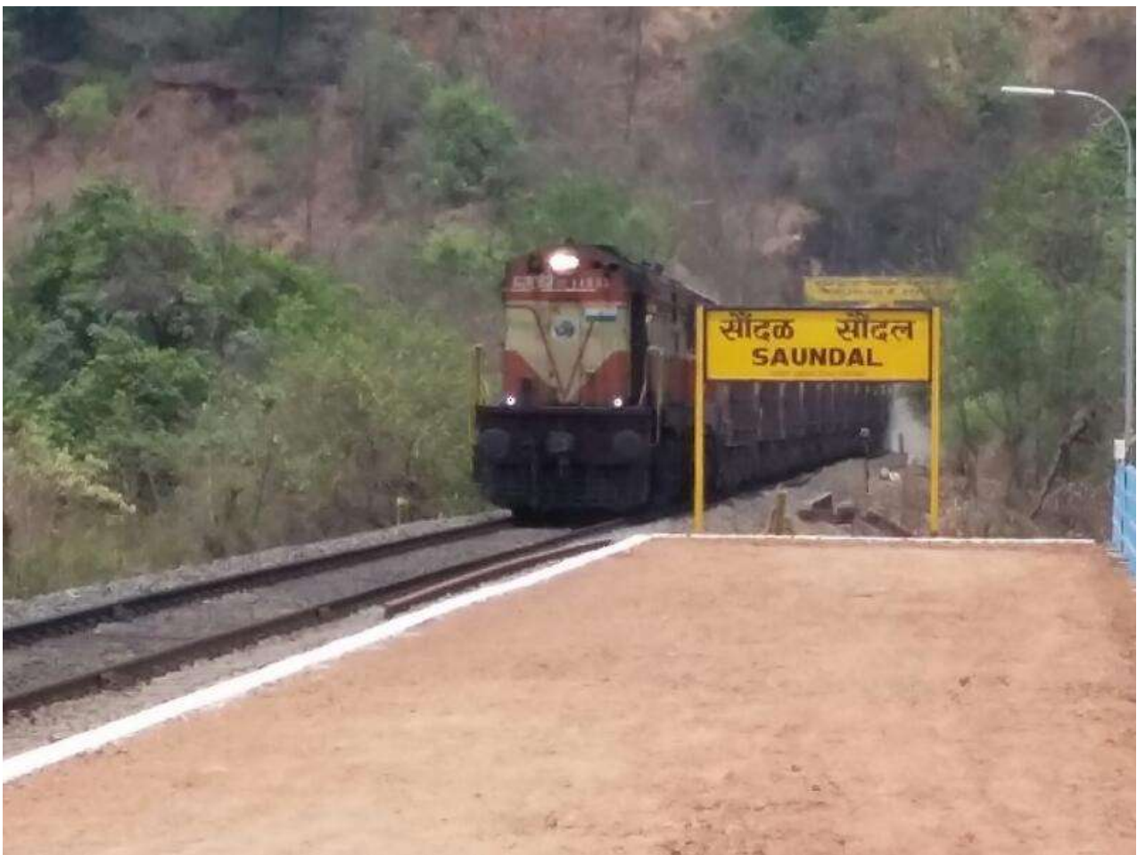
नई परिसंपत्तियों का निर्माण- महाराष्ट्र में राजापुर के पास 22 मीटर ऊंचाई पर सौंदल हॉल्ट स्टेशन