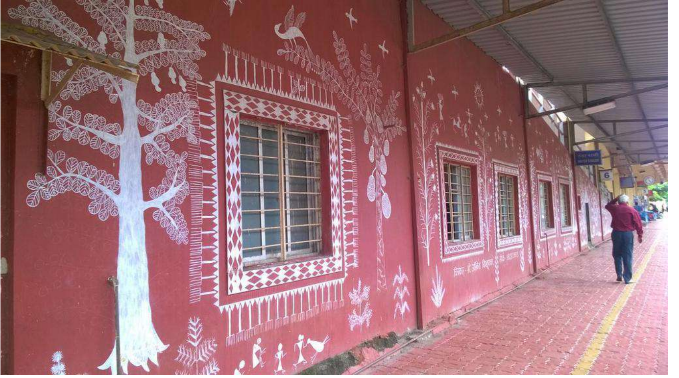
रत्नागिरी स्टेशन भवन पर भित्ति-चित्र