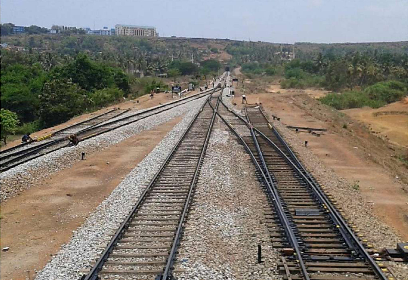
टर्न आउट पर थीक वेब स्वीचेस