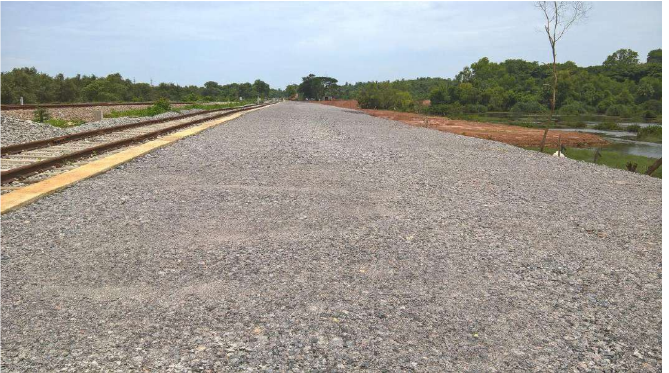
नई परिसंपत्तियों का निर्माण- कर्नाटक में मंगलूरु के पास ठेकुर यार्ड में हाफ-रेक लंबाई का साईडिंग