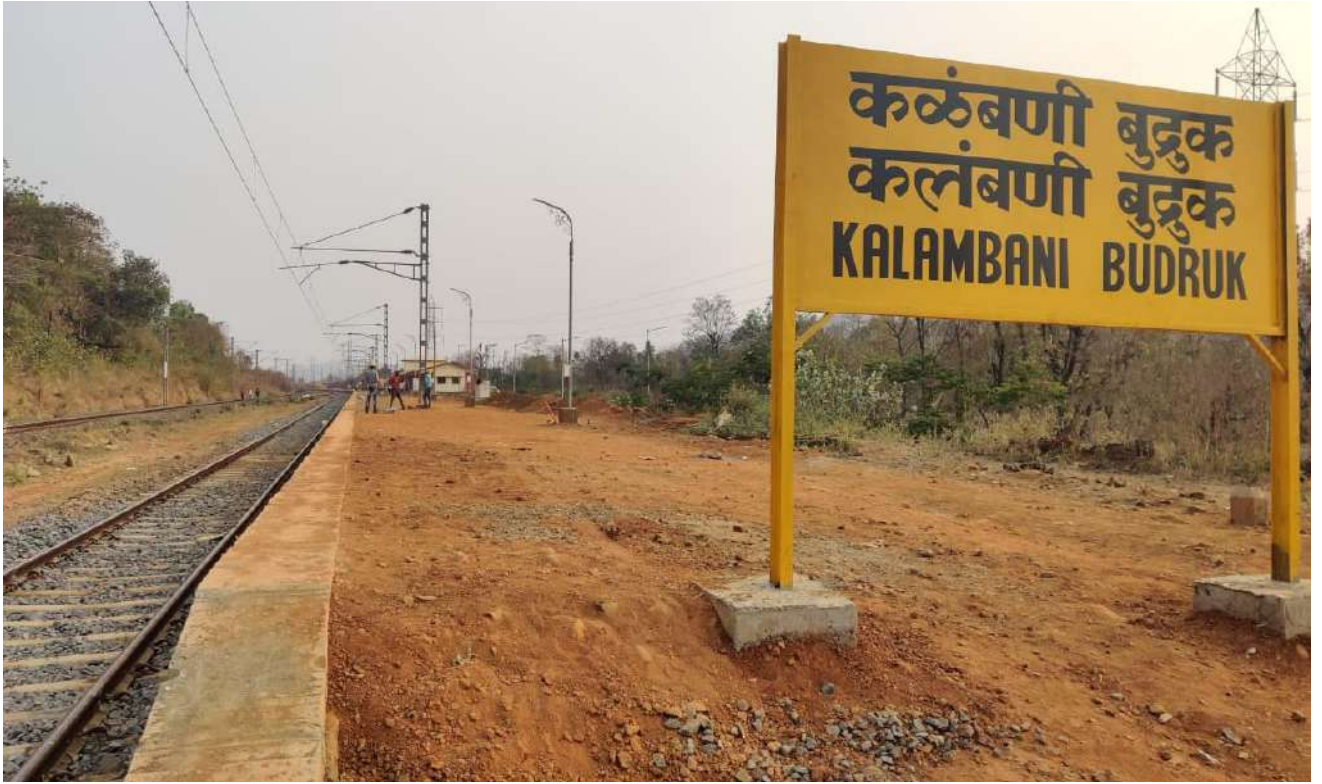
नई परिसंपत्तियों का निर्माण - महाराष्ट्र में खेड के पास कलंबणी बुद्रुक स्टेशन