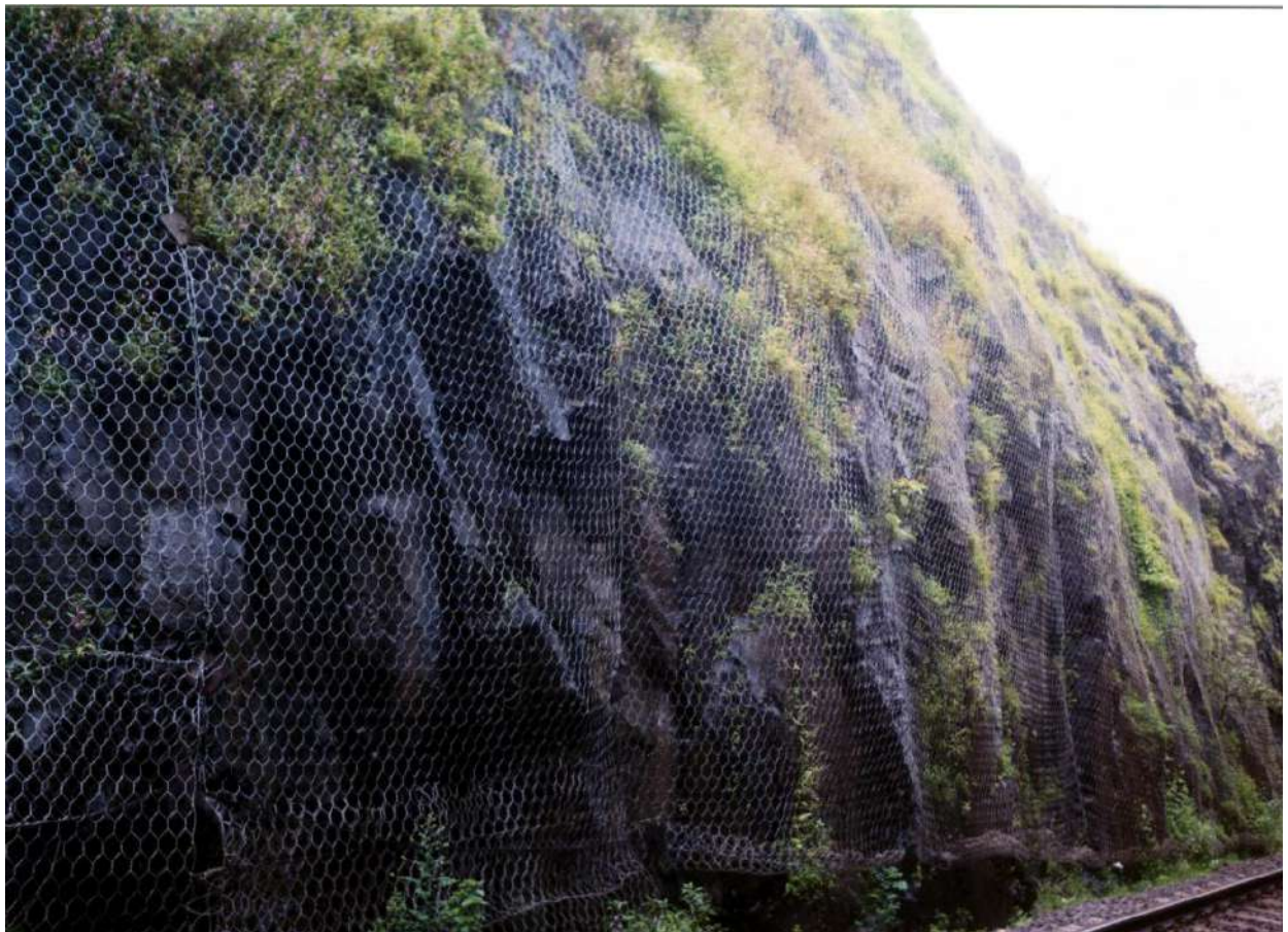
रॉक कटिंग में माध्यम क्षमता वाले बोल्टर नेट