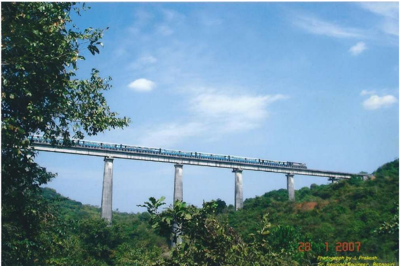
पानवल वायाइक्ट- कोंकण रेलवे का सबसे ऊंचा पुल