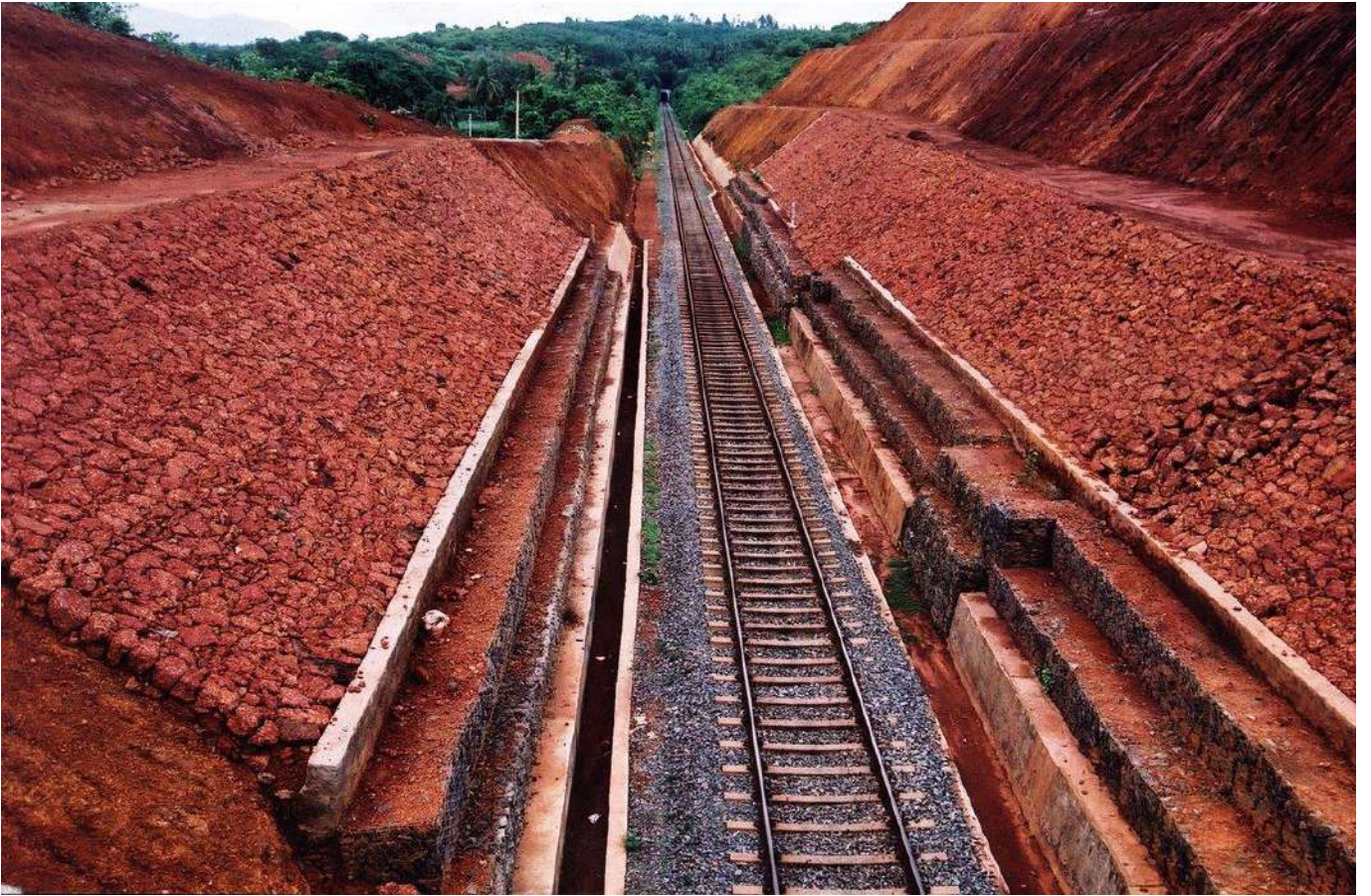
भूमि कटावों में ढलानों को समतल बनाने के कार्य तथा संरक्षात्मक कार्य