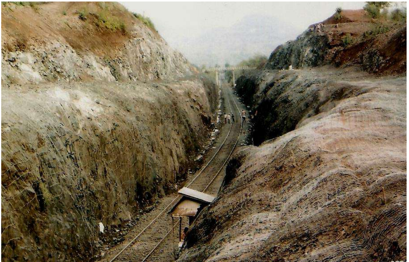
रॉक कटिंग के लिए ढलान समतल बनाने का कार्य