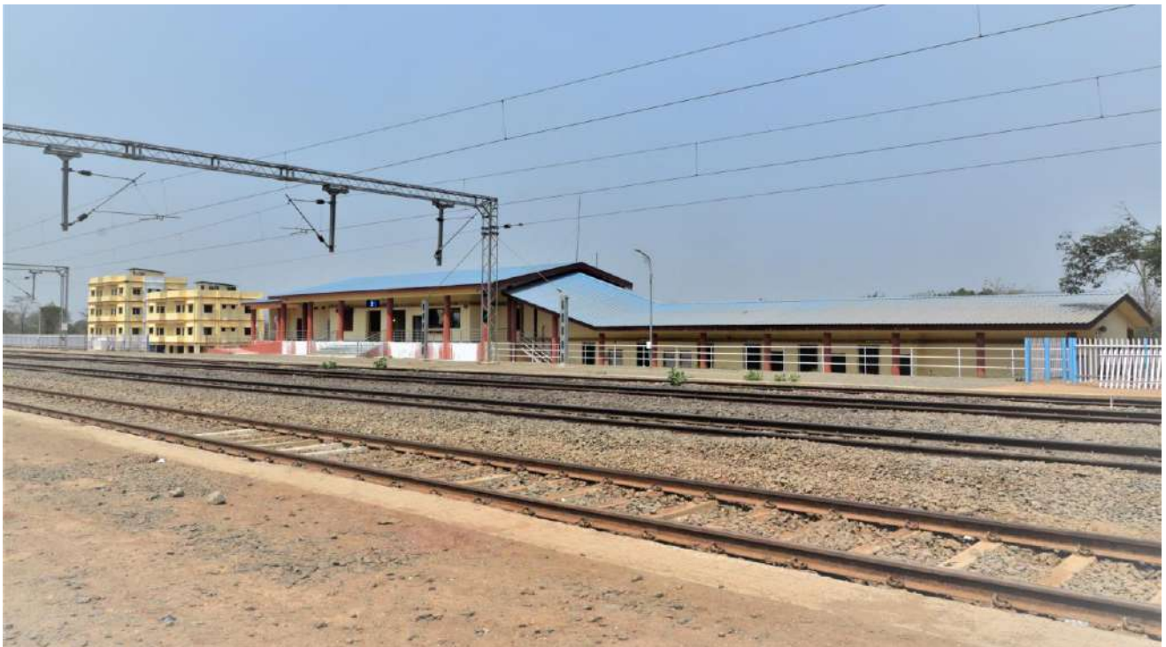
नई परिसंपत्तियों का निर्माण - महाराष्ट्र में माणगांव के पास इंदापूर स्टेशन