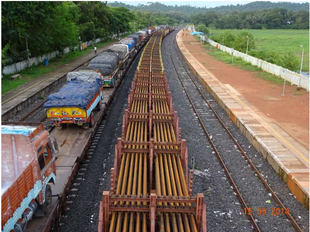
आकस्मिक रेल रिन्यूवल के लिए नए 260 मीटर के रेल पैनल