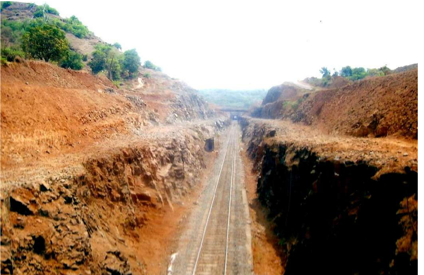
रॉक कटिंग के लिए ढलान समतल बनाने का कार्य (संरक्षा कार्य के पूर्व और पश्चात)