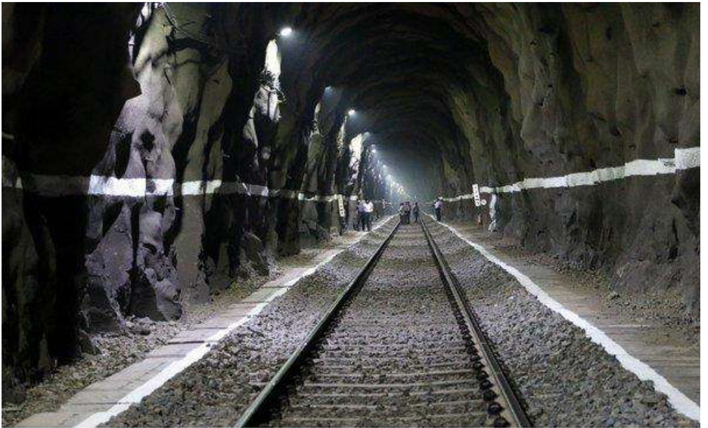
सुरंगों में स्थायी आधार - रॉक बोल्ट और शॉटक्रिटिंग