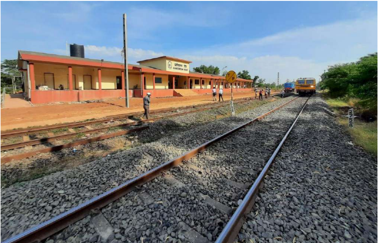
नई परिसंपत्तियों का निर्माण - महाराष्ट्र में राजापुर के पास खारेपाटन रोड स्टेशन