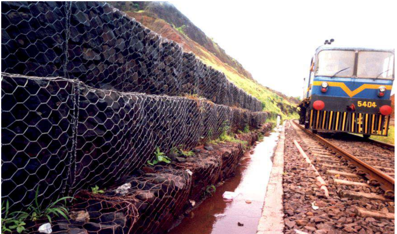
गैबियन रोक दीवार