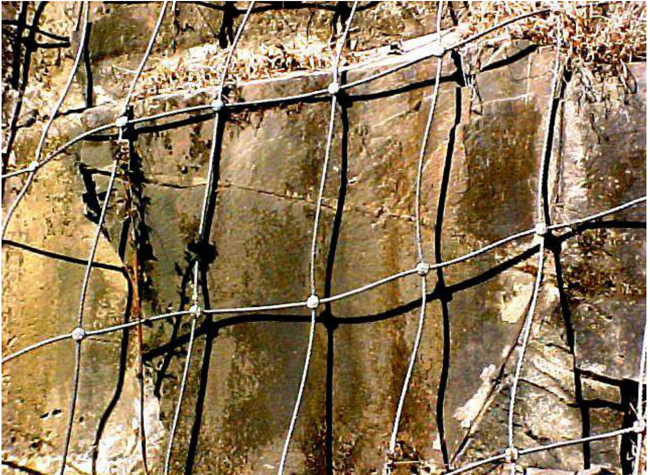
उच्च क्षमता के बोल्टर नेट (नजदीकी दृश्य)