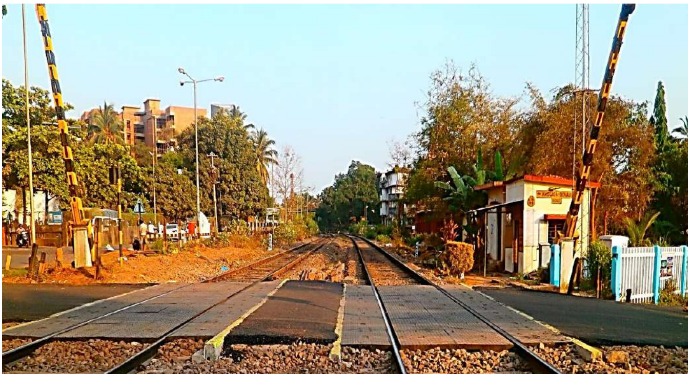
समपार फाटक पर सड़क सतह के लिए रबराइज़ पेवर ब्लॉक