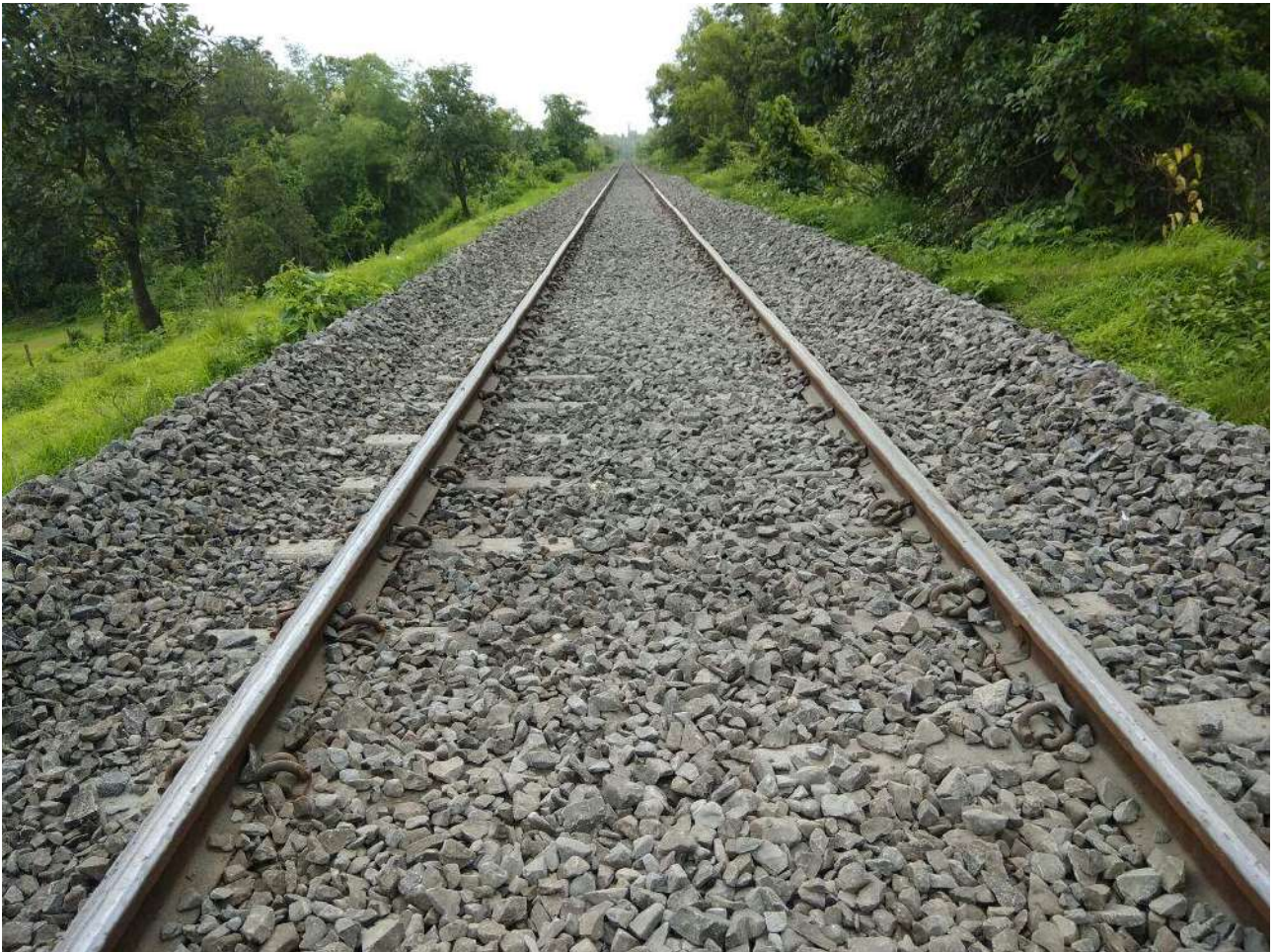
ट्रैक मशीन का कार्यसंचालन (बलास्ट रेग्युलेटिंग मशीन)