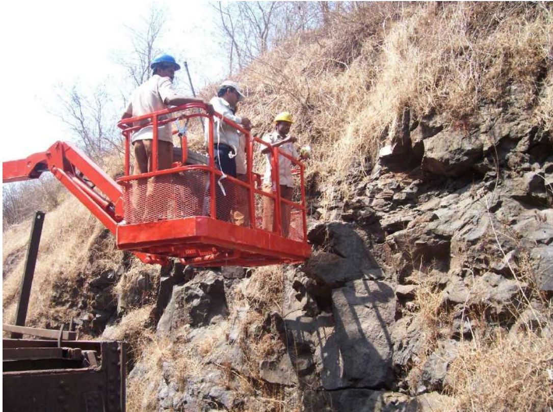
बूम लिस्ट का उपयोग कराते हुए रॉक कटिंगों में निरीक्षण तथा लूज स्केलिंग