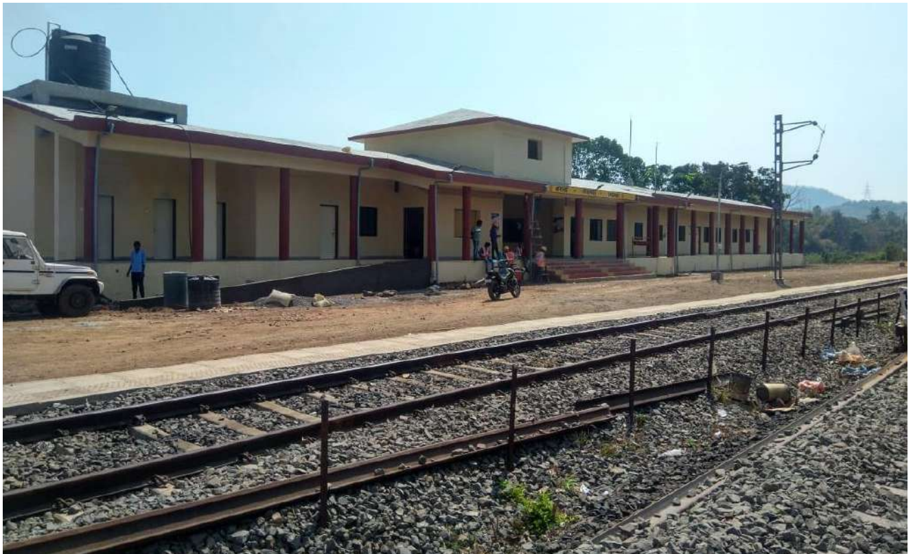
नई परिसंपत्तियों का निर्माण - महाराष्ट्र में संगमेश्वर के पास कडवई स्टेशन