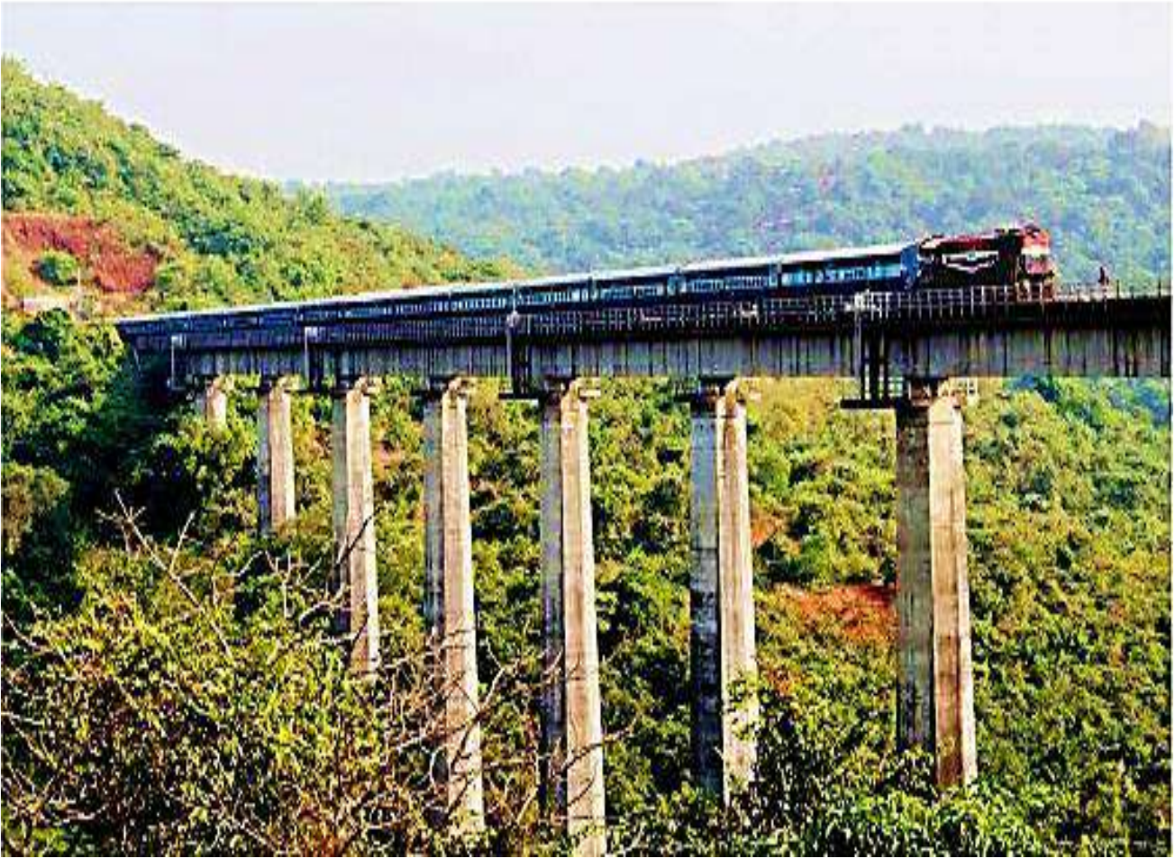
पानवल वायाइक्ट- कोंकण रेलवे का सबसे ऊंचा पुल