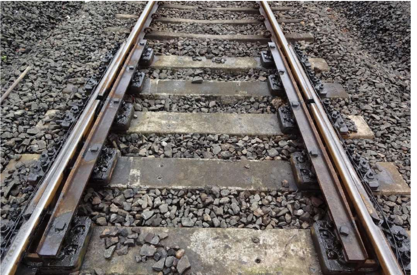
उन्नत एक्सपान्शन जॉइंट स्वीचेस