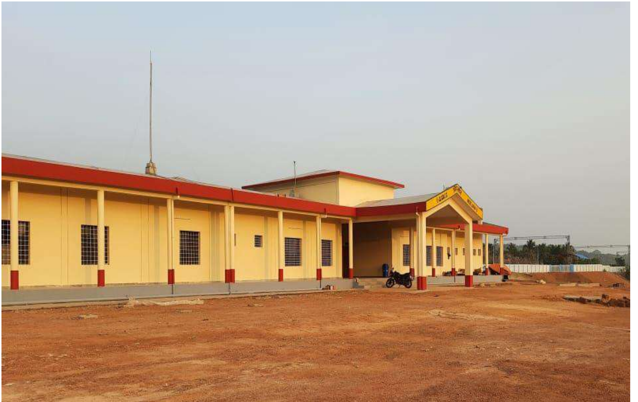
नई परिसंपत्तियों का निर्माण - कर्नाटक में कुमटा के पास मिर्जान स्टेशन