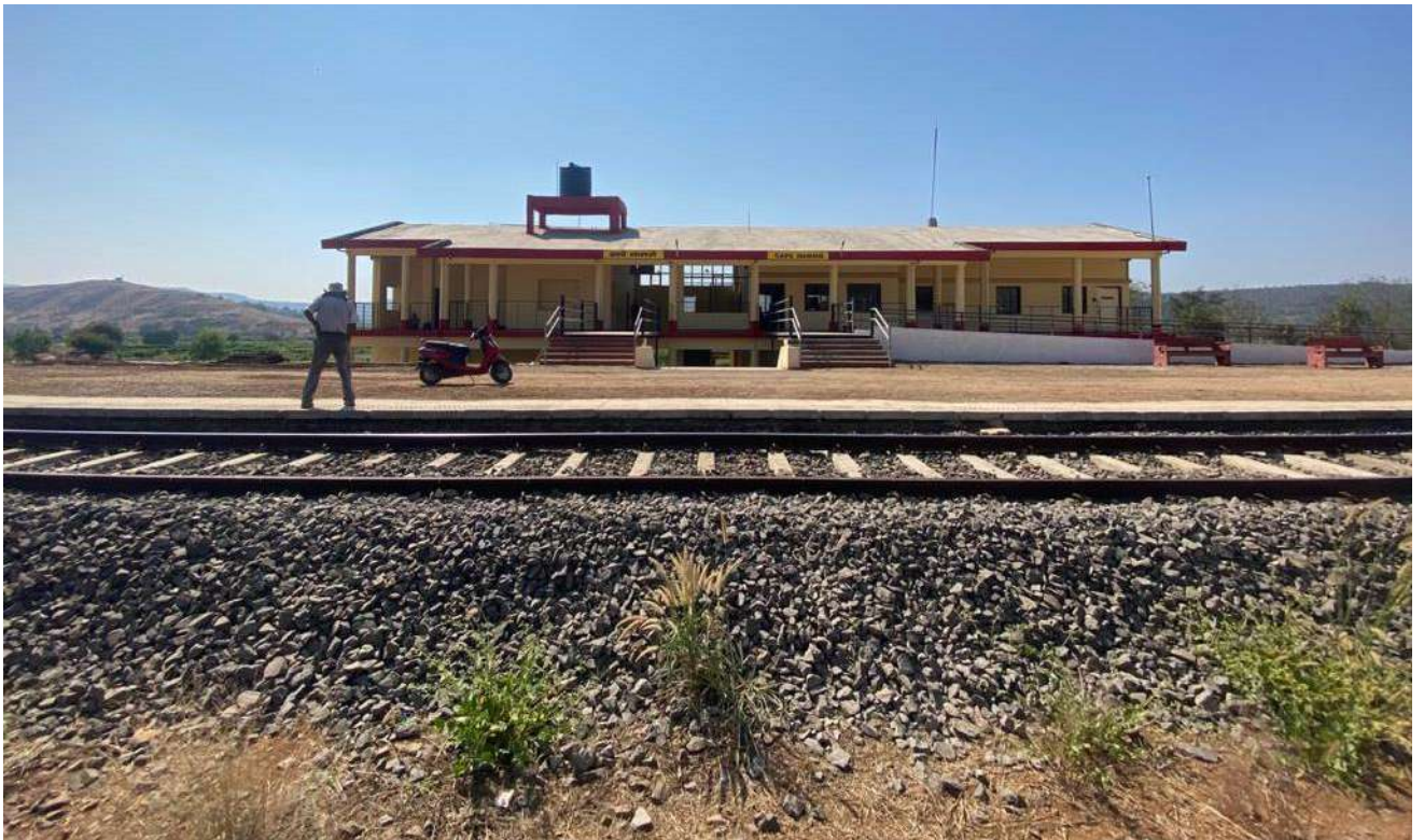
नई परिसंपत्तियों का निर्माण - महाराष्ट्र में वीर के पास सापे-वामणे स्टेशन