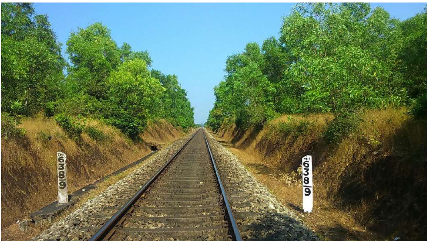
हरित रेल- ट्रैक का एक दृश्य